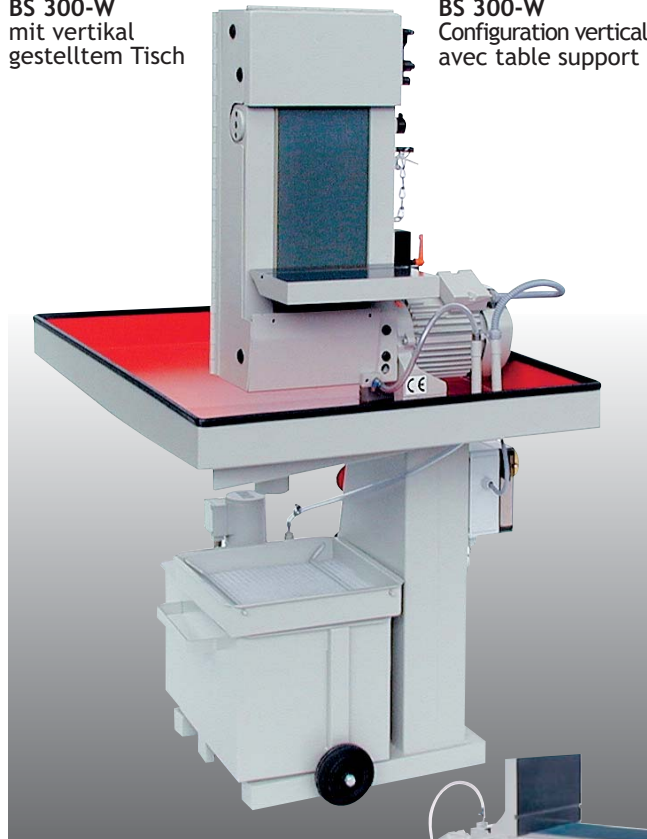
BS 300-W Configuration verticale avec table support

Tanks de surfacage avec arrosage intégré sont construits avec des moteurs plus puissants. Les égouttoires d'arrosage sont collectées dans un large radiateur qui permet l'utilisation en continu de la machine. Un filtre gravitaire situé sur le dessus du bac d'arrosage filtre le liquide et garanti l'utilisation prolongée du réfrigérant. Comme tous les tanks de la série BS le poste tank est disponible verticalement ou horizontalement. La table de travail peut être livrée inclinable en option. Inclinaison possible de -10 à +45°. Une rainure est usinée sur la table support lorsque l'option rapporteur d'angle est commandée.