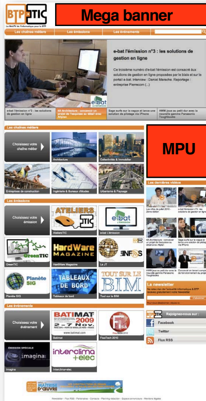
Home page of btpinformatic.fr