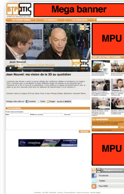
Video playback page