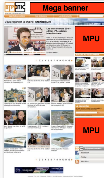
Home page of professional, broadcast or events channel